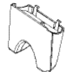
1 X High Stand 1 X Short Stand